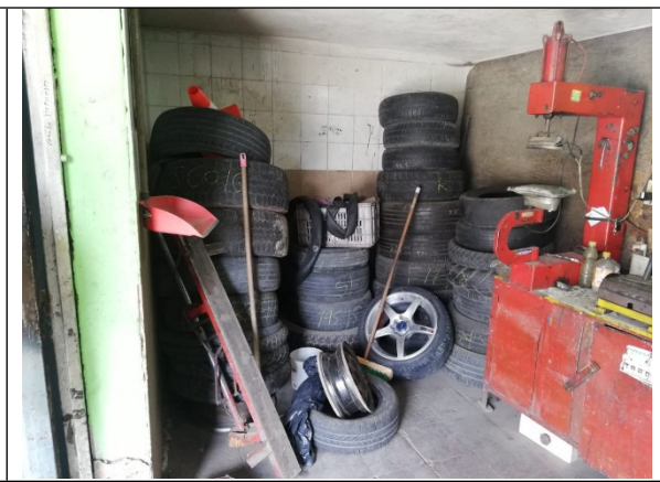
Foto 2. Vista general almacenamiento de llantas