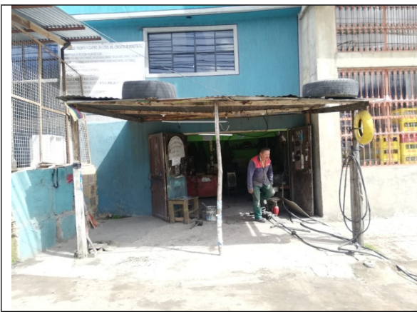
Foto 1. Vista general establecimiento